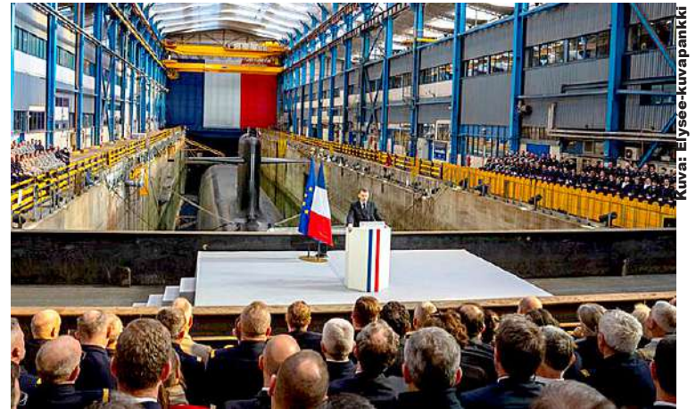
Presidentti Macron vieraili Ile Longuen tukikohdassa maanantaina 2. maaliskuuta 2026. Hän puhui siellä mm. Ranskan ydinasepelotteesta

Heti Alaskan Anchorageissa 15.8.2025 käydyin USA:n ja Venäjän huippukokouksen jälkeen kokountui Washingtonissa ns. halukkaiden koalition. He esittivät tavoitteekseen lähettää solmitun tulitauon jälkeen koalition valtioista koottuja joukkoja ”rauhanturvaajiksi” Ukrainaan, turvaamaan tulitaukoa. Kyse lienee siitä, että ne pyrkivät asettumaan Ukrainaan sisälle hämmentämään tilannetta, ”asettamaan jalansa ovenrakoon”. Tähän tietenkään Venäjä ei voi suostua. Yksi lähtökohta erikoisoperaatiolle oli, että Naton aiempien sopimusten vastai-