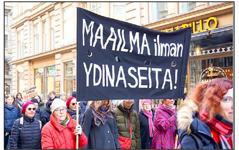
Kansainvälisen Naistenpäivän marssilla 8.3.2026 selkeästi osoitettiin, että ydinaseita ei tarvita Suomeen eikä koko maailmaan. Emma-Gaalassa Sanna Marin oli Mediapoolin toimesta tuotu värväämään suomalaiset hyväksymään ydinaseet.

Emma-Gaalan yhteydessä mediale antamassaan haastattelussa Marin suhtautui myönteisesti Orpo-Purran oikeistohallituksen aiemmin samalla viikolla antamaan esitykseen Suomen ydinaserajoituk-