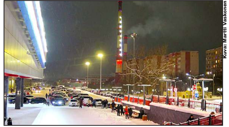
Suosittu ostoskeskus Okei. Kaupungin lämmittämiseen tarvitaan voimalaitoksia myös keskustassa. Piipun kyljessä valaistu 50 metriä korkea lämpömittari.

Hirvi on tärkeä eläin, sillä se kulkiessaan levittää kasveja ja pitää huolta siten lajien moninaisuudes-