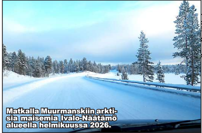
Matkalla Muurmanskiin arktisia maisemia Ivalo-Näätämö alueella helmikuussa 2026.

Ilmastomuutoksen oloissa on ymmärretty arktisen alueen haavoittuvuus. Siellä muutokset näkyvät nopeimmin ja kielteisimmän. Päätäjät ei kuitenkaan huoleta isojen sotaharjoitusten (Golden Response 26) tuominen Lapin herkkään ympäristöön. Heitä ei huolestuta katkaista tietoisesti Arktisen neuvoston työ. Vaikka elämä Muurmanskissa vaikeutuu talvella, kukaan ei halua sen muuttuvan lumettomaksi. Ikiroudan sulaminen olisi todellinen katastrofi. Tarvitaan tasa-arvoon perustuvaa rajat ylittävää kansojen välistä yhteistyötä (Kostamus). Yritykset maailman jakamiseksi tulee lopettaa.