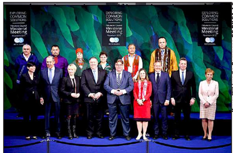
Ryhmäkuva ulkoministereistä Arktisen neuvoston kokouksessa Rovaniemellä 7. toukokuuta 2019.