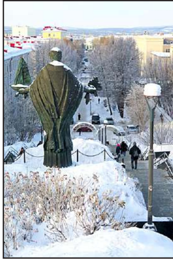
Merimiesten, kalastajien ja matkalaisten suojelupyhimys pyhä Nikolaos

Tietämättään "transatlanttisen sitemen" yhteen liittämät EU ja Nato ovat pakotteillaan vahvis-