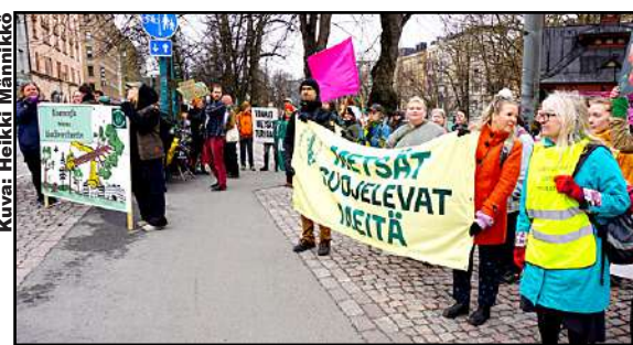
Puoliväliriihessä 22.4.2025 luonnonsuojelijat puolustivat luonnon monimuotoisuutta ja torjuivat lajikatoa.

ta. Se tarjoaa ruokaa petoeläimille ihmisten ohessa.