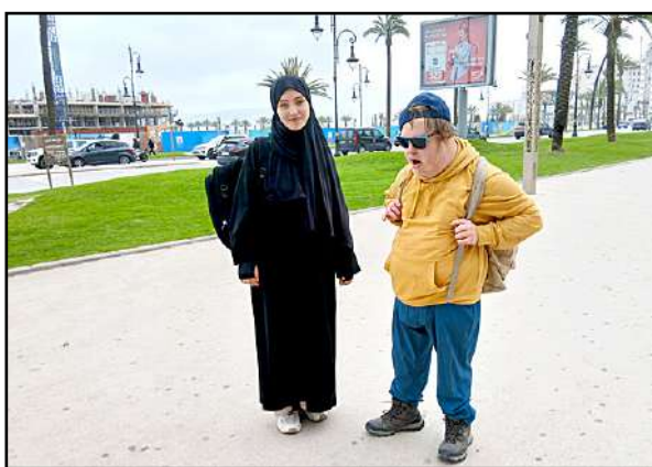
Paikallinen tyttö jäi keskustelemaan pohjoismaalaisten vieraiden kanssa. Arska toi tullessaan hyvän onnen.

Kapea Atlantin rantsubaana N16 jätiläissatamasta halki Pohjois-Afrikan vihreiden kunnaiden oli