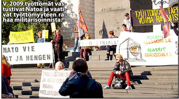
V. 2009 työttömät vastustivat Natoa ja vaativat työttömyyteen rahaa militarisoinnista.

Kirjoittaja on Valtiotieteen tohtori kansantaloustieteestä. Kirjoittaja toimi valtioneuvoston palveluksessa ministeriöissä asiantuntijana 1978-2019 40 vuotta, yksi vajaan vuoden jakso muussa tutkimuslaitoksessa.