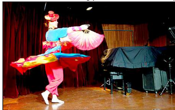
Japaninkorealaisten tanssiesitys Tokiossa

Chongryon ylläpitää monipuolista toimintaa, jonka tavoitteena on säilyttää korealainen iden-