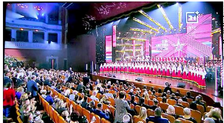
Helmikuun 23. on ylimääräinen vapaapäivä, juhlapäivä sekä Isänmaan puolustajan ja kansallisuuskäytännön päivä. Ohjelmaa on silloin televisiossa ja kulttuurikeskuksissa.

Itä-Suomessa on runsaasti tarjolla loman viettoon sopivia paikkoja Pietarin seudulla asuville lyhyen automatkan päässä. Karjalan Tasavallan kyky vastata turismin kasvuun on sekin rajallinen. Lähiseuduilla Luoteis-Venäjällä on paljon kaksoiskansalaisia, jotka odottavat raja-asemien avaamista ja mahdollisuutta tavata sukulaisiaan. Katkenneiden teollisuuden toimitusketjujen palauttaminen vie enemmän aikaa, mutta sekin on näköpiirissä. Näköpiirin laajentuminen vaatii vähintään eduskuntavaalit ja uuden valtiojohton, mikä ajaa selvästi kansal-