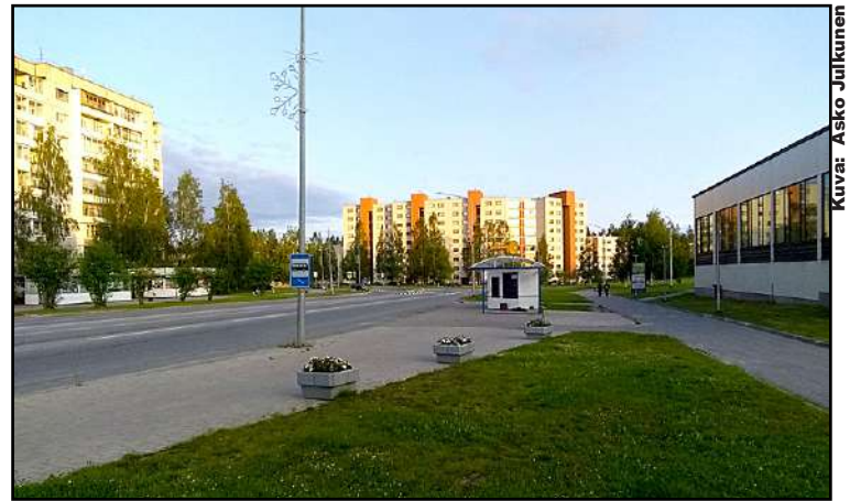
Suomalaisten ja neuvostoliittolaisten rakentamat talot sulassa sovussa Kostamuksen ilta-auringossa. Oikealla suomalaisten rakentama Druzhba-kulttuuritalo.

Vuonna 1975 Neuvostoliiton kaupan osuus Suomen ulkomaankaupasta oli noin 20 %. Neuvostoliitosta tuotiin meille raaka-aineita, kuten raakarautaa, josta tehtiin täällä terästä ja Neuvostoliitto osti meiltä suomalaisten työläisten työn tuloksina valmiita tuotteita, kuten laivoja ja koneita. Erityisesti telakat, tekstiiliteollisuus ja konepajat elivät pitkälti idänviennistä. Esimerkiksi vuoden 1973 öljykriisin aikana lisääntynyt idänvientipiti Suomen talouden rattaat pyörimässä, silloinkin kun länsivienti takkusi. Suomi-Neuvostoliitto-Seura toimi aktiivisesti Kostamus projektin toteut-