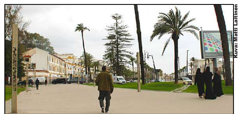
Tämän näköisiä ovat Tangerin maisemat

Olkkarin toista päätä linnoitti pitkä, sukukulmasohva. Siinä oli lämmin goisata mikrokuituberberivällyn alla. Sen yläpuolelle oli kiinnitetty kehystetty kalligrafi jostain ko-