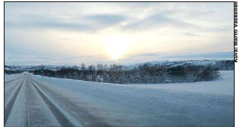
Lumierämaata matkalla Muurmanskiin