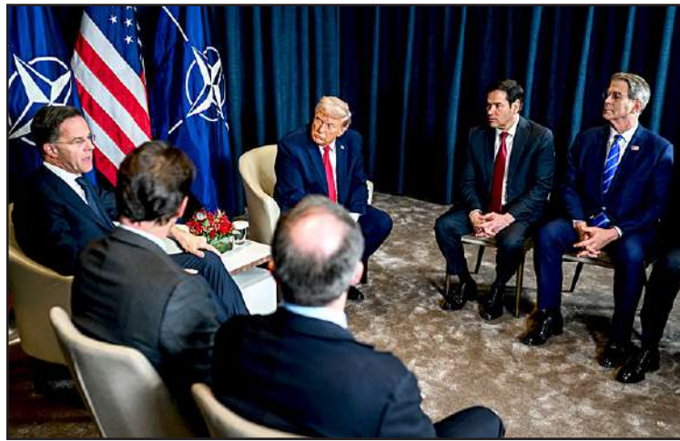
Presidentti Donald Trump ja Naton pääsihteeri Mark Rutte tapasivat Davosin talousfoorumissa 19.-23.1.2026. Rutte myöntyi Trumpin vaatimuksiin. Hänen johdollaan muodostettiin A-7 ryhmä, joka kantaa Naton osalta vastuun arktisen alueen puolustuksesta.

Kun Naton liittymisestä äänestettiin eduskunnassa , asettivat jotkut epäilevät Nato-myönteisyytensä ehdoksi, että Suomeen ei tule pysyviä sotajoukkoja muista liittokunnan maista. Tämä heille luvattiin, mutta kuinka kävikään? Muun-