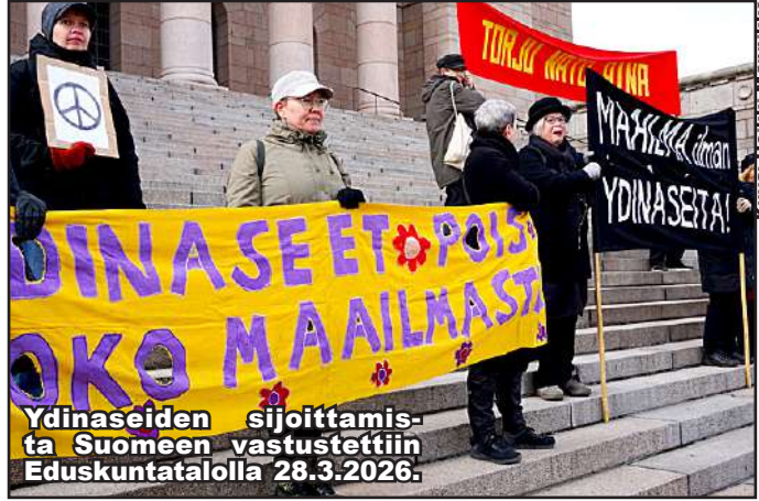
Ydinaseiden sijoittamista Suomeen vastustettiin Eduskuntatalolla 28.3.2026.

Hallituksen esitys poistaa ydinenergialaista ydinaseita koskevat rajoitukset, on keino sitoa Suomi Naton ydinasepelotteen hajauttami suunnitelmille. Stubb-Orpo-Purra unohtavat historian opetukset. Moskova esitti neuvottelua Suomelle v. 1938 ja länsi-koalitiolle v. 2021 alueelleen kohdistuvan uhan poistamiseksi. Suomi on sitoutunut v. 1947 Pariisin rauhansopimuksessa ja 1922 Venäjän kanssa solmitussa perussopimuksessa olemaan sijoittamasta alueelleen ydinaseita. Venäjä ei tule hyväksymään Suomen kautta Muurmanskin ja Pietarin alueita vastaan kohdistettua uhkaa. Se tulee muistaa.