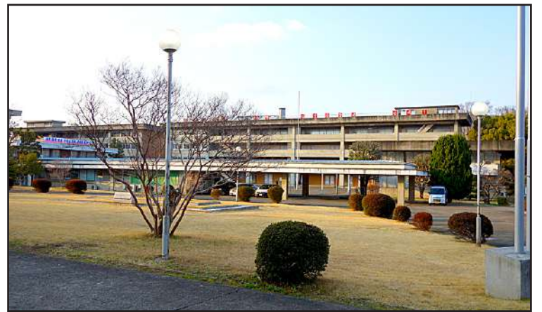
Korean yliopiston rakennuksia Tokiossa

titeetti ja tarjota yhteisön jäsenille palveluja, joita he eivät välttämättä saa muualta syrjinnän vuoksi.